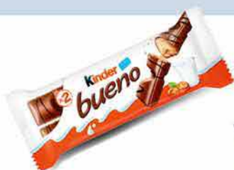
Kinder Bueno Chocolate bar 43 g