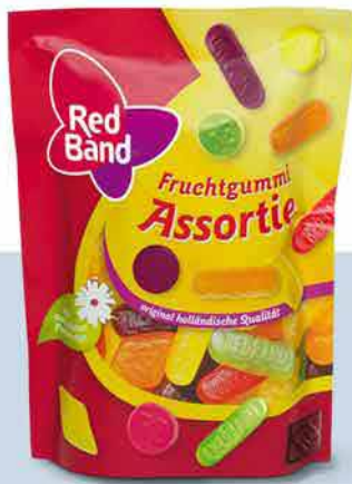
Red Band Fruchtgummi Assortie Fruit gums 200 g