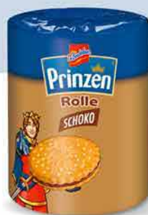
Prinzenrolle Biscuit roll 141 g