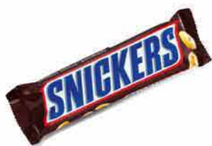
Snickers Chocolate bar 50 g