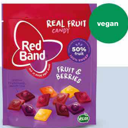
Red Band Fruit & Berries Vegan fruit gums 190 g