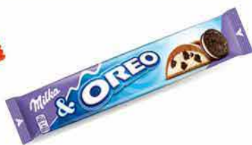
Milka Oreo Chocolate bar 37 g