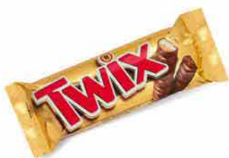
Twix Chocolate bar 50 g